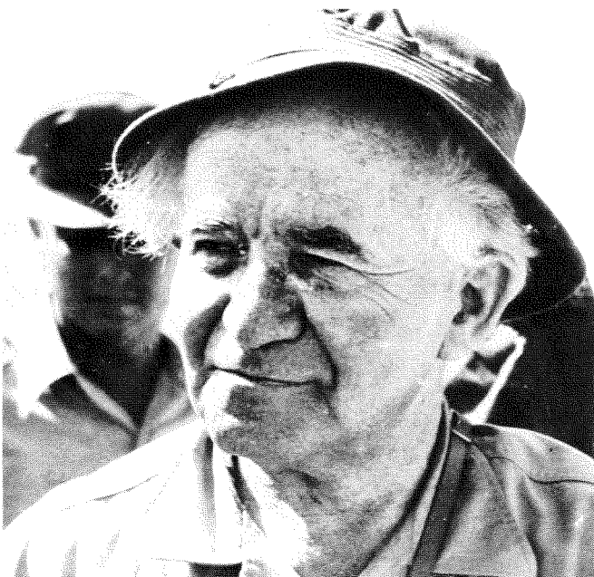
בן גוריון ביולי 1958 בעת ביקור בחפירות חצור